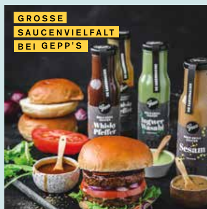
GROSSE SAUCENVIELFALT BEI GEPP'S

KUBUS Aalen Direkt am Rathaus Am Marktplatz 26 73430 Aalen Öffnungszeiten und weitere Informationen auf kubus-aalen.de