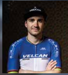
TITOUAN PERRIN GANIÉR 🇫🇷 FRANCE AGE: 30 YEARS 4 TIMES WORLD CHAMPION