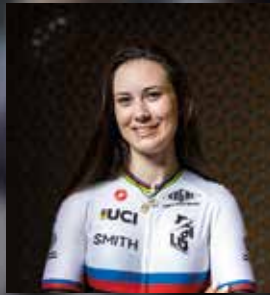
GAIA TORMENA 🇮🇹 ITALY AGE: 19 YEARS WORLD CHAMPION 2021