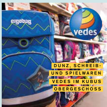
DUNZ, SCHREIB- UND SPIELWAREN VEDES IM KUBUS OBERGESCHOSS