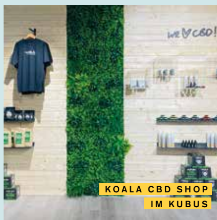
KOALA CBD SHOP IM KUBUS