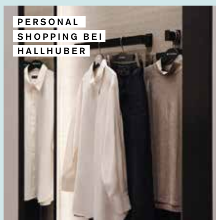
PERSONAL SHOPPING BEI HALLHUBER