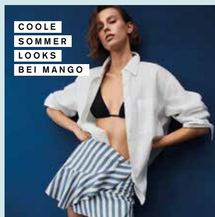
COOLE SOMMER LOOKS BEI MANGO