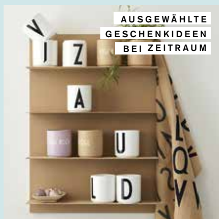
AUSGEWÄHLTE GESCHENKIDEEN BEI ZEITRAUM