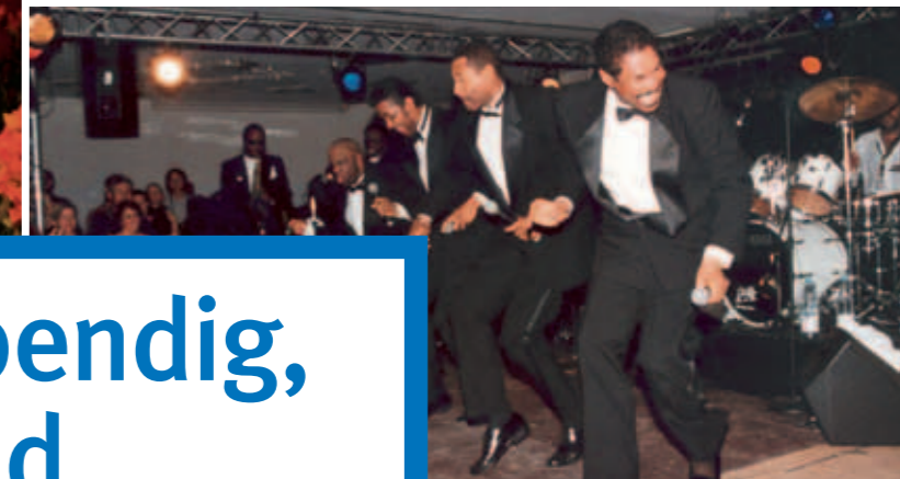
↩ Theater der Stadt Aalen