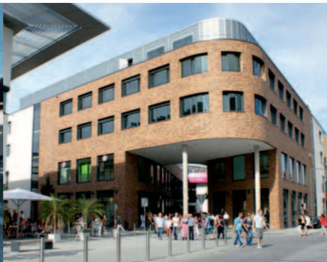
↖ Mercatura Einkaufszentrum

→ Die sympathische Stadt Aalen ist erfrischend, attraktiv und besitzt ein großes Zukunftspotenzial.