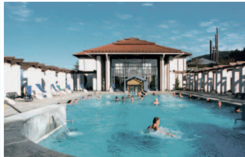
↘ Limes-Thermen Aalen