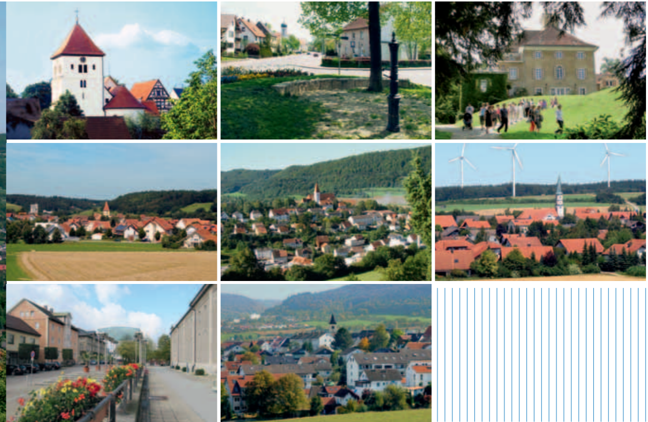
↑ Die Teilorte: Dewangen, Ebnat, Fachsenfeld, Hofen, Unterkochen, Waldhausen, Wasseralfingen, Hofherrnweiler (v. l. n. r.)

Die Sicherung von Lebensqualität in allen Teilen der Stadt liegt uns besonders am Herzen. Wir gewährleisten die Entwicklung und den Ausbau eines funktionierenden und bürgernahen Angebotes an Infrastruktur- und Serviceleistungen.