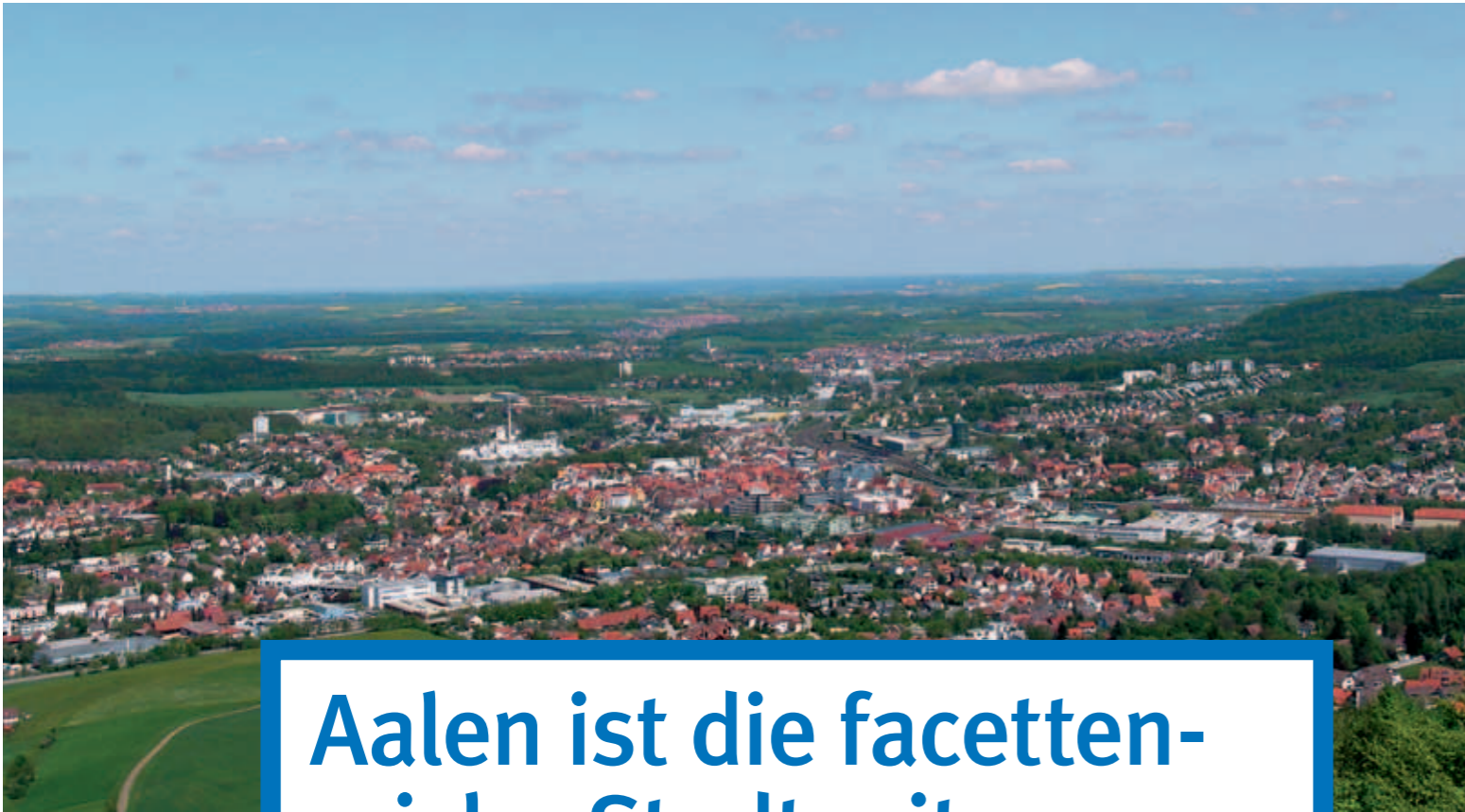
↗ Aalen im Panorama