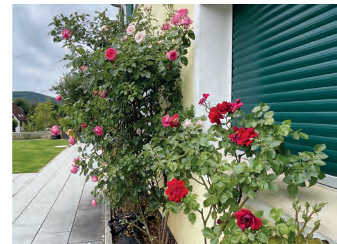
Fassadenbegrünung als gezieltes Gestaltungselement.

Wer kann einen Förderantrag stellen? Als Privatperson, Eigentümergemeinschaft oder gemeinnütziger Verein können Sie einen Antrag auf Förderung stellen. Soweit ausreichend Fördermittel zur Verfügung stehen, können auch Firmen und Einrichtungen von Religions- und Weltanschauungsgemeinschaften eine Zuwendung beantragen.