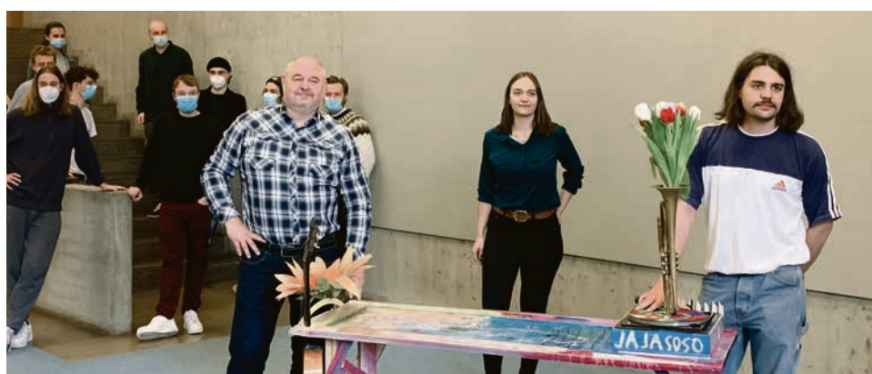
Aktion für Gastronomie, Kunst und Kultur.

„Die Gastronomen waren von unserer Idee sofort begeistert, bisher haben wir 12 feste Zusagen wobei wir jeden Tag neue Anmeldungen erhalten“, erzählte Skusa. Die zusätzliche Fläche im Außenbereich hat die Stadtverwaltung bereits genehmigt. So kann jeder Gastronom ohne weitere Kosten an der Aktion teilnehmen. Interessierte Betriebe können sich gerne bei Aalener City aktiv ( info@aalencityaktiv.de ) oder bei Kollektiv K ( info@kollektiv-k.net ) zur Teilnahme melden.