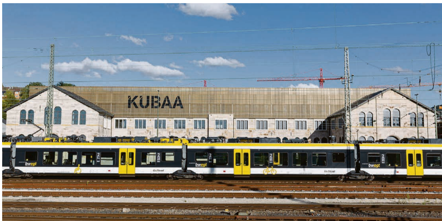
Der Hauptbahnhof Aalen ist wichtiger Verkehrsknotenpunkt im Schienenverkehr.

Im Arbeitsbereich ÖPNV und Schienenverkehr richtet sich der städtische Fokus auf den raschen zweigleisigen Ausbau und die Elektrifizierung der Brenzbahn. Dabei soll aus städtischer Sicht ein Bahnhof Aalen-Süd (Höhe Erlau/Pelzwasen) in die konkrete Umsetzungsplanung aufgenommen werden. „In Aalen-Süd gibt es ein hohes Fahrgastpotenzial durch Berufspendler. Dort