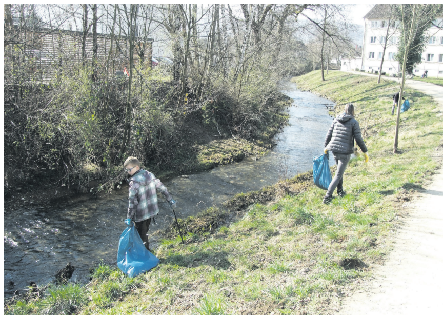
Am 18. März findet in Aalen wieder die Flurputzete statt. Hierfür werden engagierte Helfer*innen gesucht.

Kurzentschlossene können sich auch noch am Samstag, 18. März um 8 Uhr am Bauhof, Heinrich-Rieger-Straße in Aalen einfinden.