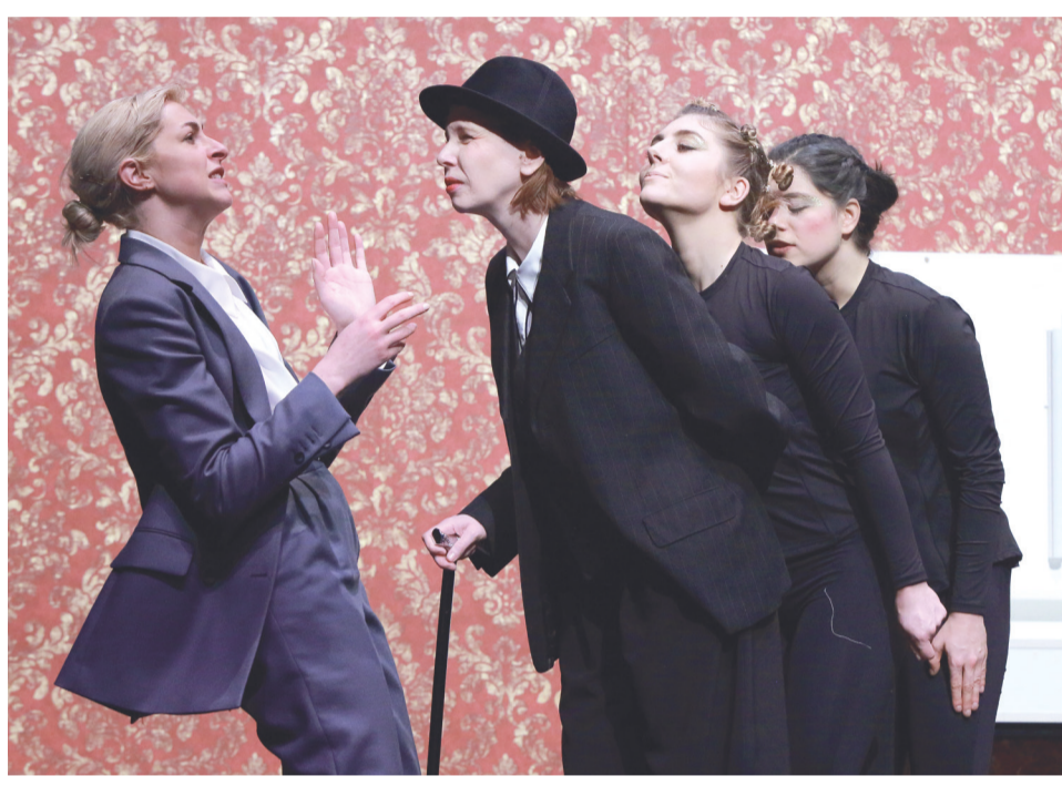
Szenenbild aus „Bekenntnisse des Hochstaplers Felix Krull“, einer Produktion des Theaters der Stadt Aalen aus der Saison 2022/23.

An den verschiedenen Spielorten der Stadt – dem Kulturbahnhof, der Aalener Stadthalle sowie der Studiobühne im Alten Rathaus – wird es Inszenierungen unter anderem aus Mannheim, Karlsruhe, Bruchsal, Baden-Baden und Tübingen zu sehen geben.