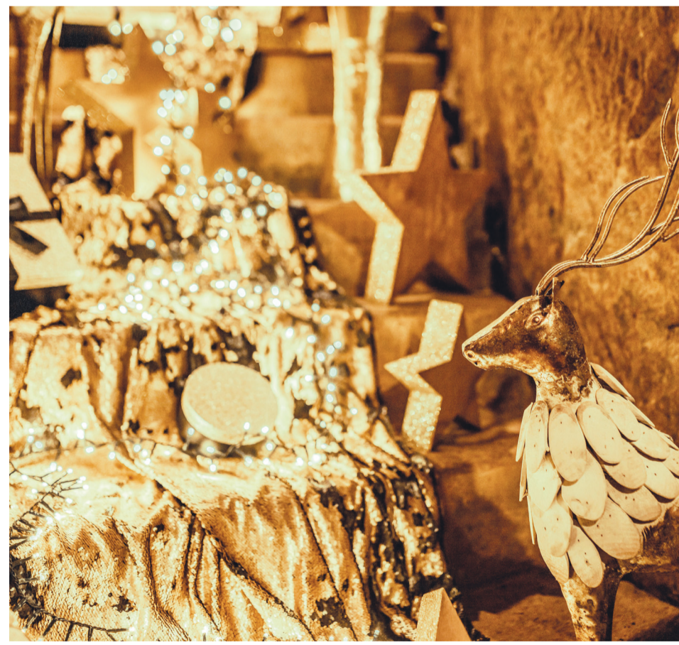
Weihnachten steht vor der Tür. Wer noch ein Geschenk sucht, wird in Aalen garantiert fündig.