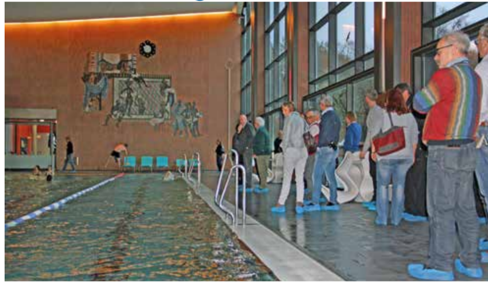
Besichtigung des generalsanierten Hallenbads „Südbad“ in München.

Vom 25. bis 26. November besichtigte eine Aalener Delegation, bestehend aus Mitgliedern des Gemeinderats, Vertretern der Stadtverwaltung und der Stadtwerke sowie Experten der Bäderspezialisten Kannewischer mehrere Bäder in München, Nürnberg und Hamburg. Dabei konnten sich die Delegationsteilnehmer wertvolle Anregungen für die im kommenden Jahr im Gemeinderat zu diskutierende Bäderkonzeption einholen.