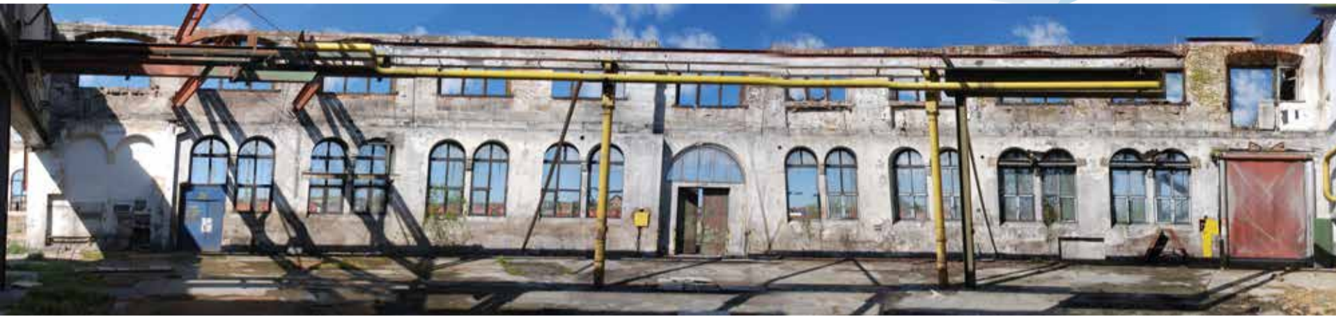
Blick in die Überreste des ehemaligen Bahnausbesserungswerks in Richtung der Bahngleise.

NEUE SPIELSTÄTTE FÜR MUSIKSCHULE, THEATER DER STADT AALEN UND KINO AM KOCHER