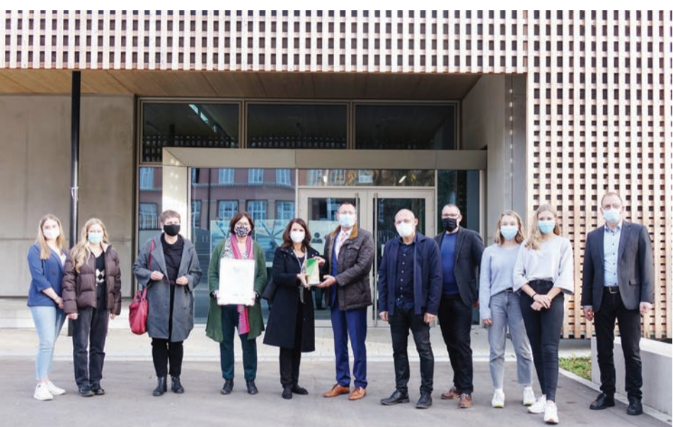
Wenige Tage vor der Preisverleihung besuchte Staatssekretärin Rita Schwarzelühr-Sutter (Mi.) das Gymnasium.