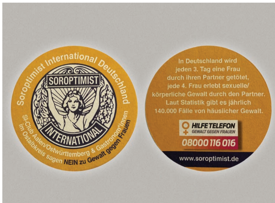
Gemeinsam mit den örtlichen Gastronomen setzen die SOROPTIMISTINNEN eine Bierdeckelaktion um.

Im vergangenen Jahr haben die SOROPTIMISTINNEN auf der Ostalb, in Aalen, Schwäbisch Gmünd und Ellwangen bereits die Aktion „Blutrote Schuhe“ in den Innenstädten, jeweils in Kooperation mit den Frauenbüros, gestartet. Dabei wurden mit