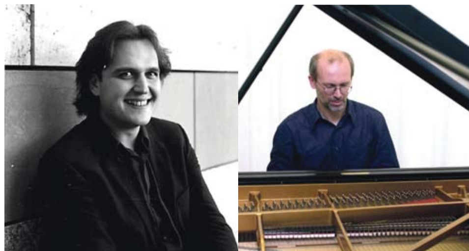
Cellist Vjaceslav Kiselev und Pianist Andreas Dürr

Die Musikschule Aalen veranstaltet am Samstag, 30. November 2013 ihr diesjähriges Danke-Konzert für den Förderverein der Musikschule. Das Konzert beginnt um 18.30 Uhr im Herbert-Becker-Saal der Musikschule, Hegelstraße 27.