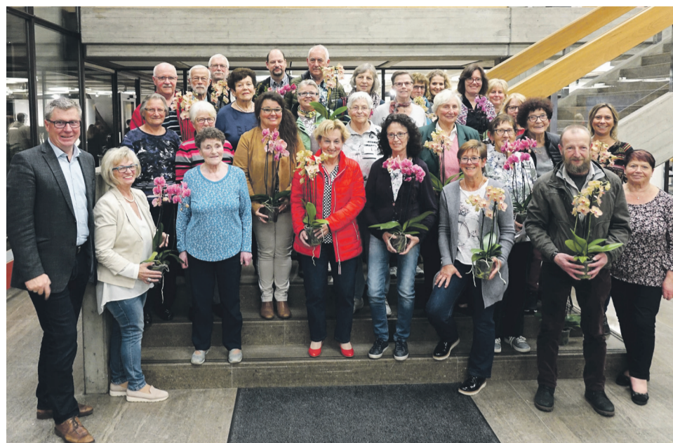
Die Preisträgerinnen und Preisträger der Aalener Kernstadt und Weststadt.