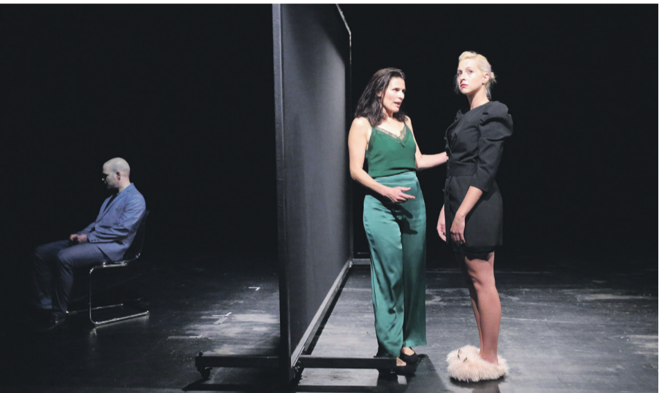
Szene aus dem Stück „Wing.Suit“, das am Freitag, 8. November Premiere feiert.

Seit diesem September hat für das Theater der Stadt Aalen die letzte Spielzeit unter dem Motto „Innere Sicherheit“ im Wirtschaftszentrum in der Ulmer Straße begonnen. Nach 25 Jahren geht 2020 eine Ära zu Ende: Alle Akteure freuen sich auf die neue Spielstätte im Kulturbahnhof auf dem Stadtoval.