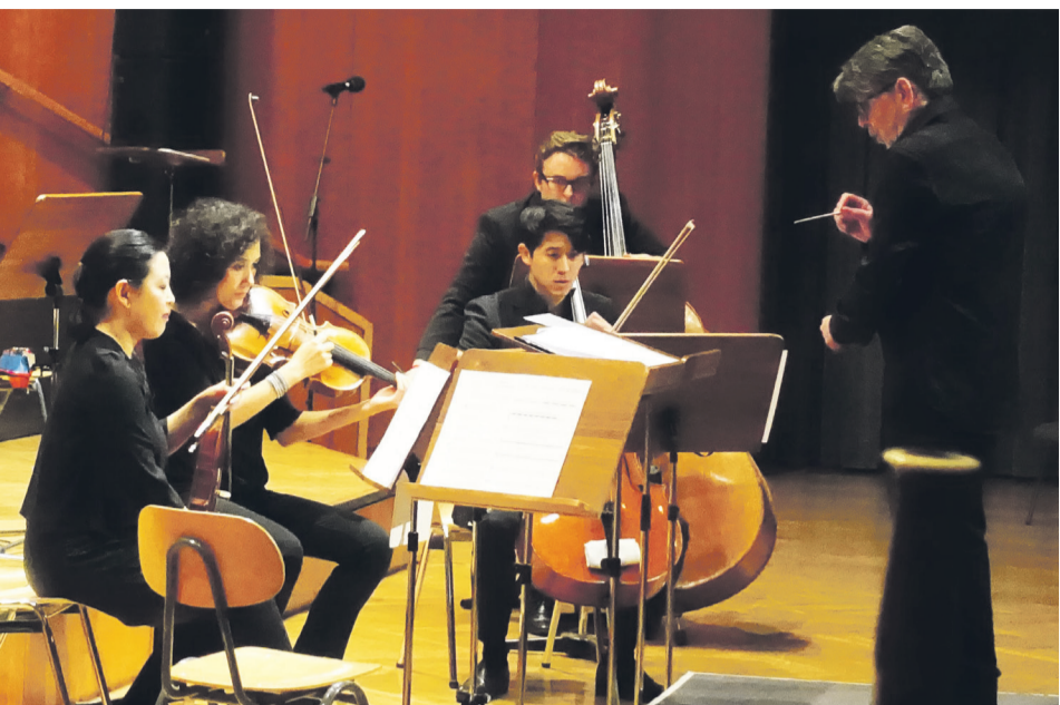
Das Ensemble πk.

Konzert im Evangelischen Gemeindehaus am Samstag, 16. November, um 19 Uhr