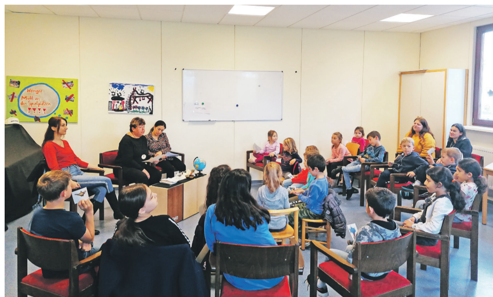
Gespannt hörten die Kinder den Märchen zu.