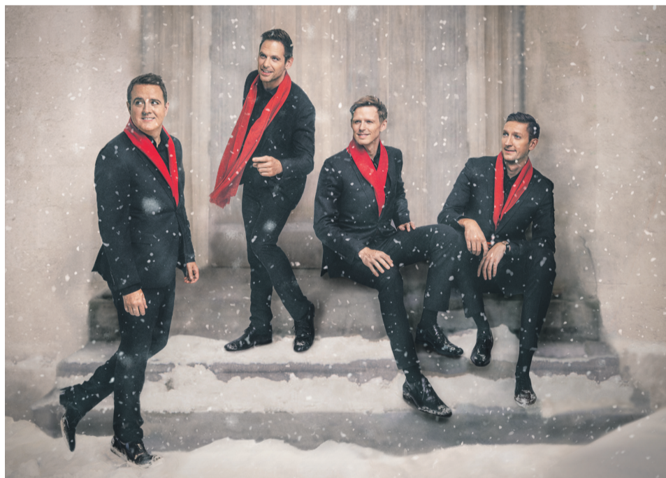
Ringmasters – Die Barbershop-Sänger aus Schweden.