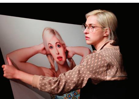
Szene aus „Das Heimatkleid“.

Telefon: 07361 52-2600 oder Mail: kasse@theateraalen.de