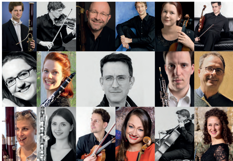
Mitglieder des neu gegründeten AALEN Festival Orchesters.

Karten für die Konzerte sind an den bekannten Vorverkaufsstellen erhältlich: Tourist-Information Aalen, Reichsstädter Straße 1, 73430 Aalen, Telefon 07361-52-2358 oder unter www.reservix.de .