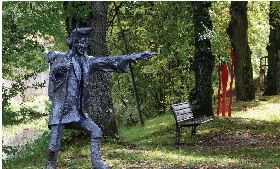
Die Plastik der „Pilger“ wurde von Sieger Köder und seinen hiesigen „Krippelfrauen“ gestaltet.

Im Anschluss folgt die Tour den Spuren von Sieger Köder auf dem Weg an der Kocherhalbinsel „Im Kies“ und am „Alten Kirchle“ vorbei bis zum neuen Baugebiet Maiergassee. Auf der rund 6 ha großen ehemaligen Industriebrache entsteht in zentraler Lage