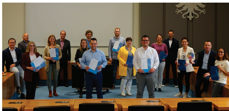
Die Dezernenten beglückwünschten die Teilnehmenden zum erfolgreichen Abschluss.

Mögliche Talente auch innerhalb der Stadt Aalen zu identifizieren und zu fördern bringt eine win-win-Situation: Die Mitarbeitenden kennen sich in der Organisation aus und die Kultur der Stadt Aalen. Auf der anderen Seite sind Karrieremöglichkeiten gefragte Aspekte bei der Wahl des Arbeitgebers.