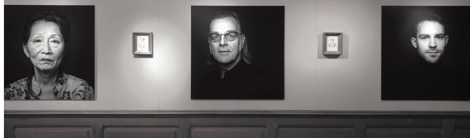
Im Pleuer-Saal auf Schloss Fachsenfeld sind die Bilder nun zu sehen.

Ort der Diskussion ist der Pleuer-Saal auf Schloss Fachsenfeld. Die Ausstellung „Kreative Köpfe“ wurde aufgrund des 2-tägigen Gnießermarkts von Ökonomiegebäude in die gegenüberliegenden Schloßräume verlegt.