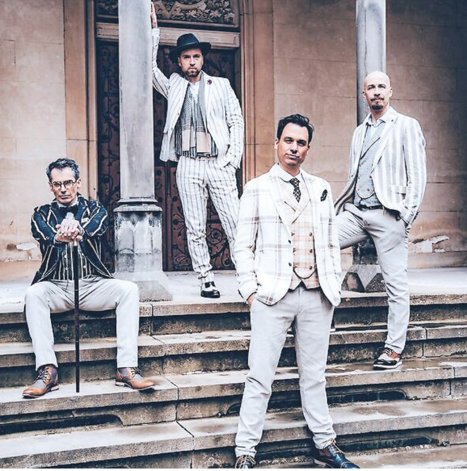
Die Mitglieder der A Cappella Band Maybepop.

Karten sind im Vorverkauf in der Tourist-Information Aalen, Verkefor 07361 52-2359 und unter www.reservix.de erhältlich.