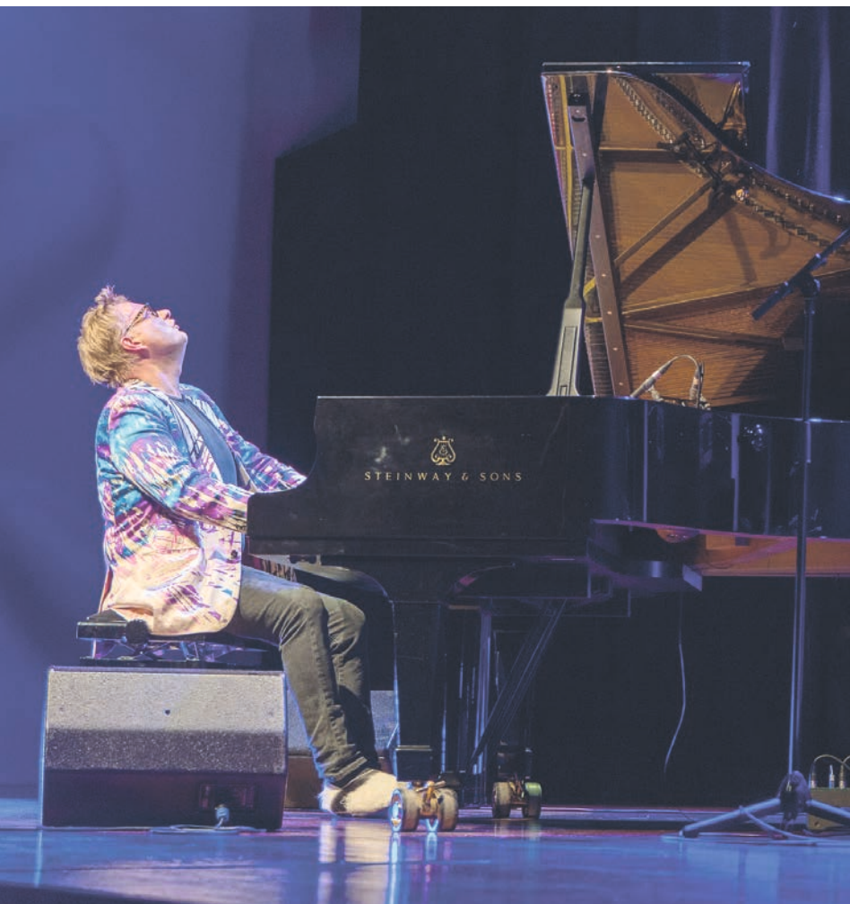
Iiro Rantala ist einer der bekanntesten Jazzmusiker Finnlands. Er gibt seine Musik am Mittwoch, 2. November beim Jazzfest zum Besten.