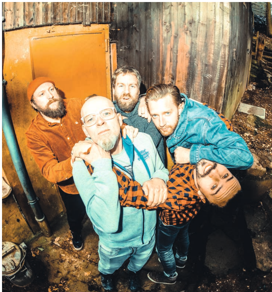
Thomas D & The KBCS2 treten am Freitag, 4. November beim Aalener Jazzfest auf.

„Totale Dynamik, faszinierend, spannend und ungemein weltoffen. Die Rede ist natürlich vom Aalener Jazzfest. Anfang November ist es wieder soweit und wer ganz vorne mit dabei sein will, der besorgt sich bereits jetzt Eintrittskarten. Das Aalener Top-Event nicht nur in seinem 31. Jahr, es ist auch längst so legendär, wie die Liste der in Aalen bereits aufgetretenen Stars lang ist.“