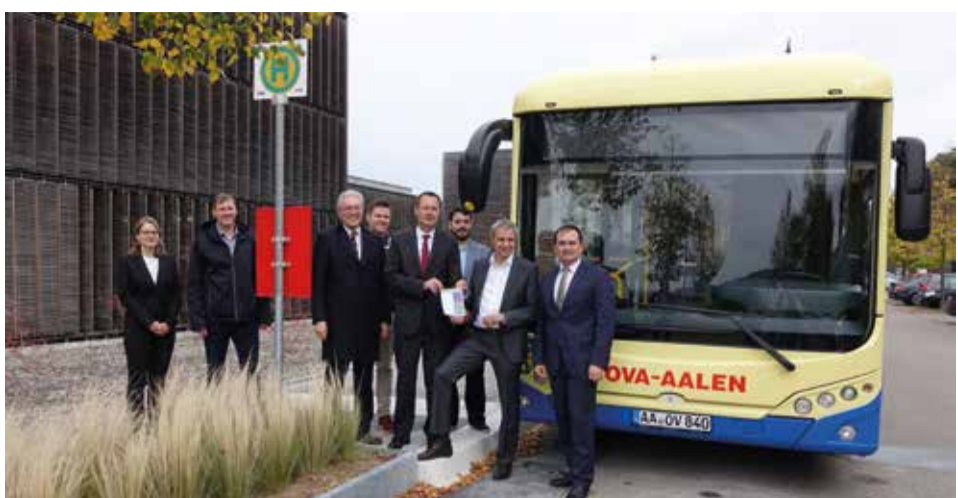
Neue Haltestelle im Campus Burren.