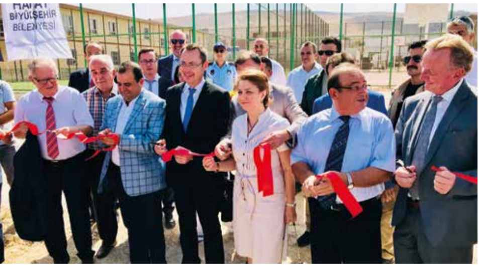
Feierliche Eröffnung des Multifunktions-Sportplatzes.

Nun, da der Sportplatz fertig ist, setzt Aalen einen finanziellen Schlussstein auf die Hilfsprojekte, „wohlwissend, dass weitere Projekte nötig sind“, sagt Rentschler und überreicht Savas das Buch „Kriegskinder“, das in Zusammenarbeit mit den „Aalener Nachrichten“ entstanden ist. Es dokumentiert die Zusammenarbeit der Partnerstädte und es schildert Erlebnisse der Kinder, die in ihrer Heimat grauenvolle Dinge erlebt haben. Frieden im In- und Ausland könne nur gelingen, „wenn es an Menschlichkeit nicht mangelt“, sagt Savas. Was aus Menschlichkeit und der deutsch-türkischen Zusammenarbeit auf kommunaler Ebene trotz aller politischer Spannungen entstehen kann, dokumentiere nun das Buch – es sei ein Beleg dafür, dass die Verbindung der Partnerstädte stark ist, sagt Rentschler. „Stärker als eine kurz- oder mittelfristige politische Entwicklung.“