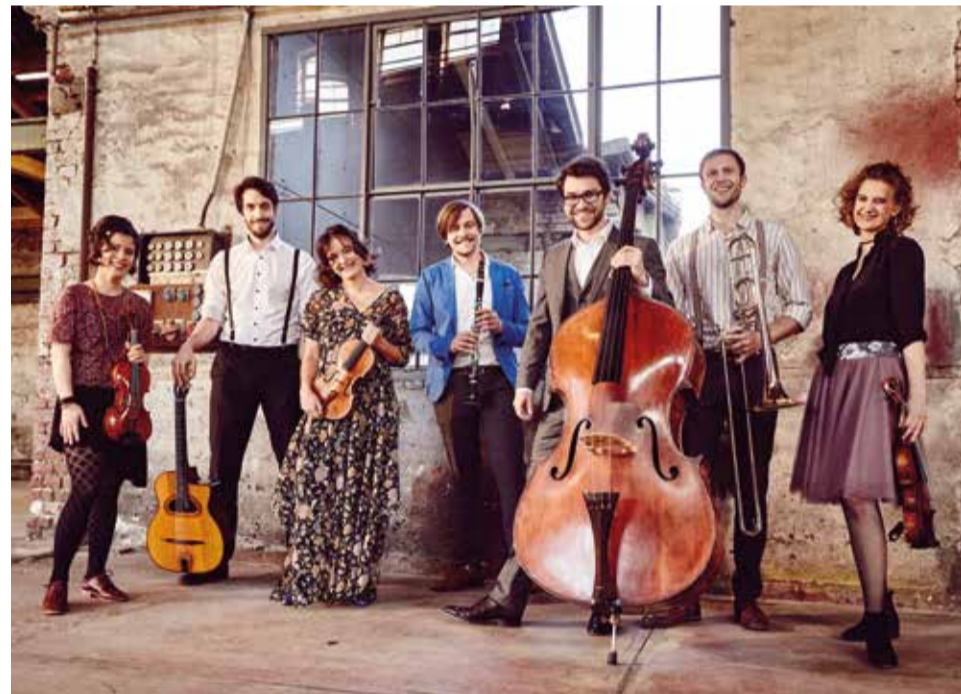
Die Klezmer Gruppe Yxalag.

Unser Schwerpunkt liegt immer wieder bei der osteuropäisch jüdischen Klezmermusik. Die Musiker dieses Genres spielten auf Hochzeiten im Shtetl diese bestimmte Musik, aber sie ließen sich ständig inspirieren von Musikern anderen ethnischen Hintergrunds, wie z.B. den Roma-Musikern oder der regional typischen Volksmusik. Das passierte auch später in den USA der 50er Jahre, als emigrierte jüdische Musiker sich mehr mit Jazz