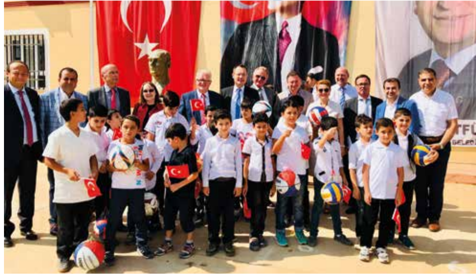
Mit einem Festakt in Reyhanli haben die Partnerstädte Aalen und Antakya / Hatay den Sportplatz an der Schule für syrische Flüchtlingskinder eröffnet.

Dass die Partnerschaft auch in schwierigen Zeiten nicht zur Einbahnstraße wird, wünscht sich Lütfü Savas gleichermaßen. „Wir werden unser Bestes geben, damit es immer weiter geht“, verspricht Hatays Oberbürgermeister, der die Städtepartnerschaft mit einem Baum vergleicht, dessen starker