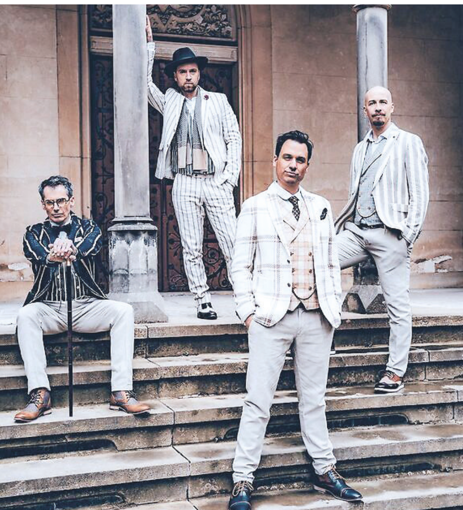
Die Mitglieder der A Cappella Band Maybebop