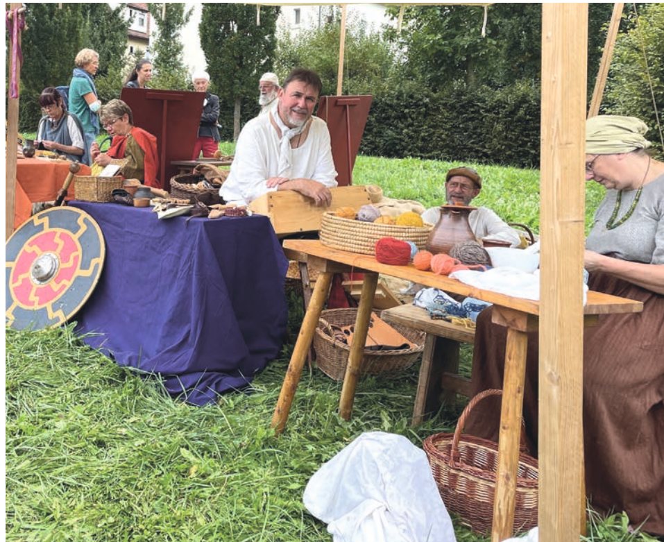
Verschiedene Gruppen zeigen das römische Alltagsleben anhand verschiedener Aspekte.

Erwachsene: 6 Euro Ermäßigt: 4 Euro Familien: 13,50 Euro