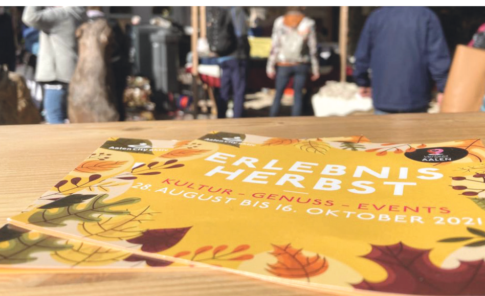
Unter dem Motto „Kultur - Genuss - Erlebnis“ gibt es zahlreiche Veranstaltungshighlights in der Innenstadt zu entdecken.

Mit vielen Veranstaltungen für die ganze Familie startet der Innenstadtverein „Aalen City aktiv“ (ACA) in diesen Herbst. Am Samstag, 24. September, geht es mit einem Gsälz & Chutney-Märkte los. Bis Sonntag, 6. November, gibt es zahlreiche Veranstaltungshighlights der Innenstadt zu entdecken.