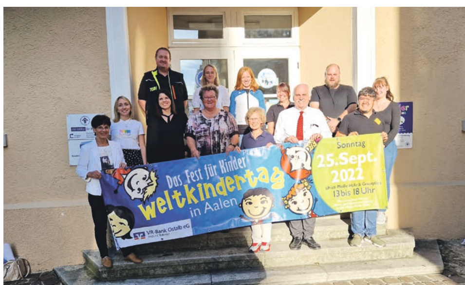
Es herrscht große Vorfreude auf das Weltkindertagsfest am Sonntag, 25. September 2022 auf dem Greutplatz.

Hauptsponsor dieses großen Festes ist die VR-Bank Aalen. Organisator der Stadtjugendring Aalen e.V. Telefon 07361 66855 E-Mail sjr@sjr-aalen.de