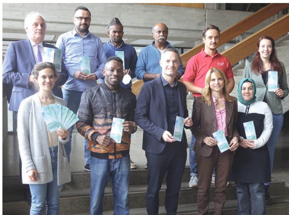
Die Mitwirkenden der Interkulturellen Woche präsentierten gemeinsam mit OB Brütting das Programm.

Unter dem Motto „Was uns verbindet“ finden im Rahmen der interkulturellen Woche von 18. September bis 9. Oktober wieder zahlreiche Veranstaltungen in Aalen statt.