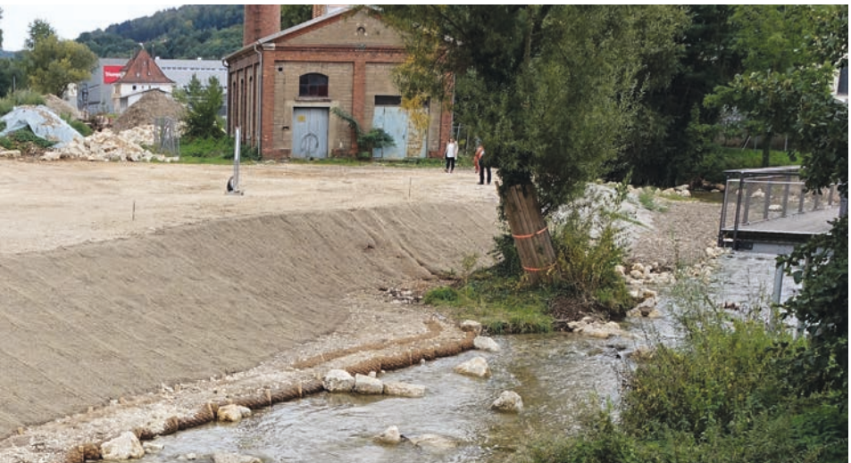
Im Rahmen der Renaturierung wurde der Flusslauf des Kochers neugestaltet und die Uferböschung verändert.

Die Gesamtkosten der Baumaßnahmen sind mit 4,45 Millionen Euro veranschlagt, das Land Baden-Württemberg übernimmt rund 54 Prozent davon.