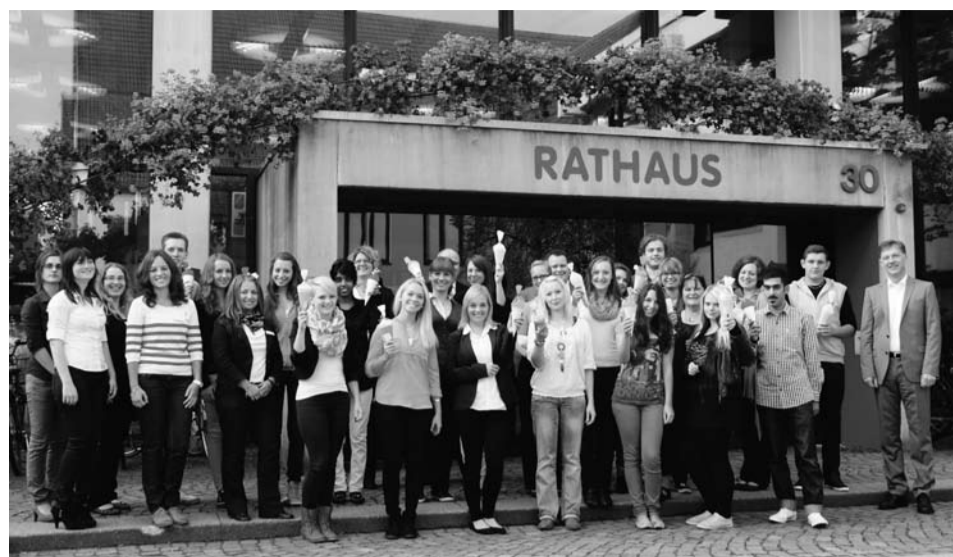
OB Martin Gerlach begrüßt mit Vertretern des Personalamtes und des Personalrates die 23 neuen Auszubildenden (mit Schultüten) vor dem Rathaus.

23 junge Erwachsene haben im September 2012 ihre Ausbildung bei der Stadt Aalen begonnen. Oberbürgermeister Martin Gerlach hieß die Auszubildenden am Einführungstag in der Stadtverwaltung herzlich willkommen.