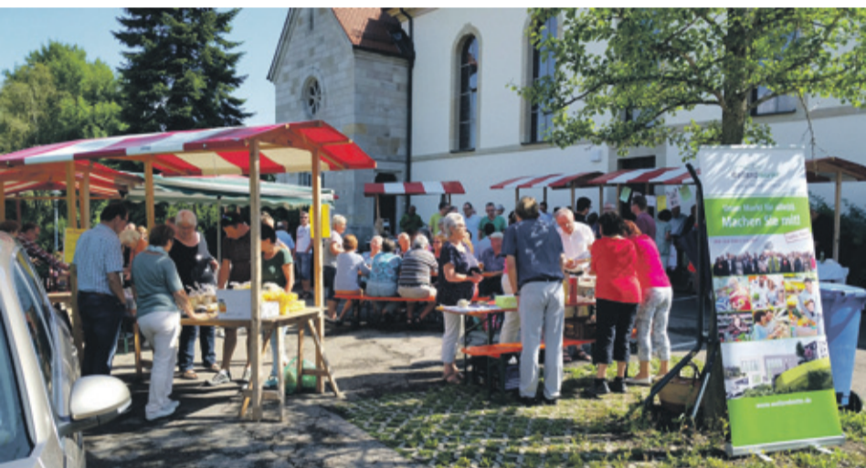
Schönes Wetter beim „SommerMarkt“