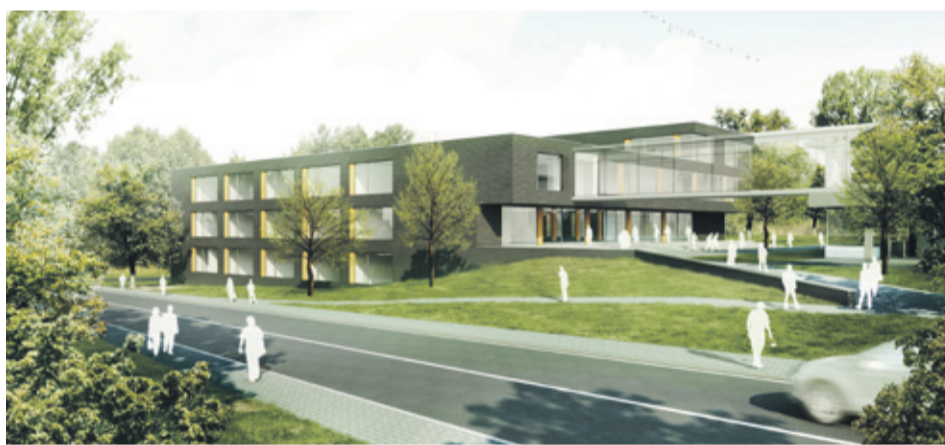
Visualisierung des neuen Forschungskomplexes an der Rombacher Straße: Heimat für ZTN und ZIMATE