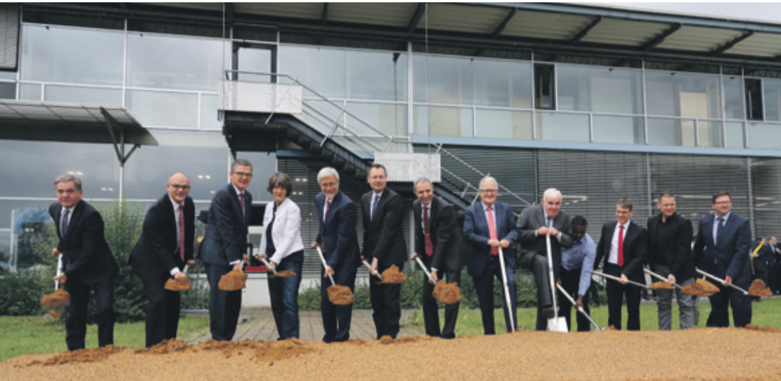
Spatenstich für ZIMATE und ZTN