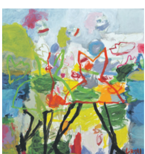
Drei Grazien © Paul Groll 2016

„Ut pictura poesis“ – „Dichtung ist wie Malerei“, so die Aussage des römischen Dichters Horaz. Ein treffender Satz für die aktuelle Ausstellung HANDZEICH[N]EN von Paul Groll. Denn die Inspirationsquelle für seine neuen Bilder sind das Wort bzw. die Lyrik. Wenn das Gedicht ein sprechendes Bild ist, dann lässt sich das Gemälde als schweigende Poesie begreifen.