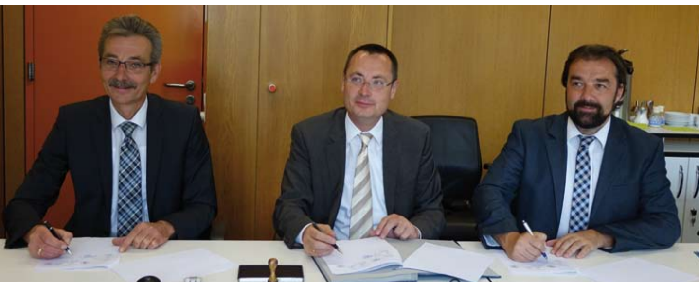
v.l.n.r. Bürgermeister der Gemeinde Schechingen, Werner Jekel, Oberbürgermeister der Stadt Aalen, Thilo Rentschler und Bürgermeister der Gemeinde Abtsgmünd, Armin Kiemel bei der Vertragsunterzeichnung zum interkommunalen Breitbandausbau.

Die Stadt Aalen und die Gemeinden Abtsgmünd und Schechingen werden beim Ausbau der Breitbandinfrastruktur kooperieren. Mit ihrer Unterschrift unter den öffentlich-rechtlichen Vertrag besiegelten Oberbürgermeister Thilo Rentschler und