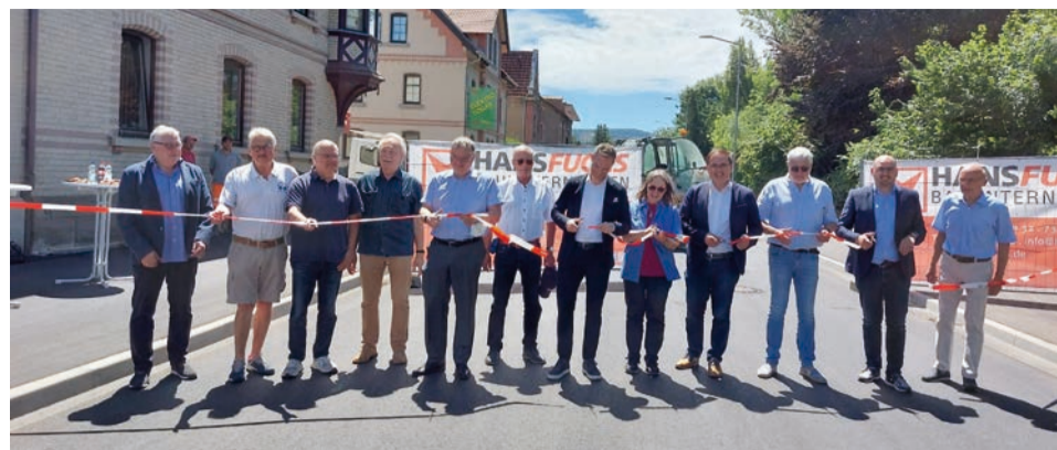
Am 13. Juli wurde die Wilhelmstraße wieder für den Verkehr freigegeben.