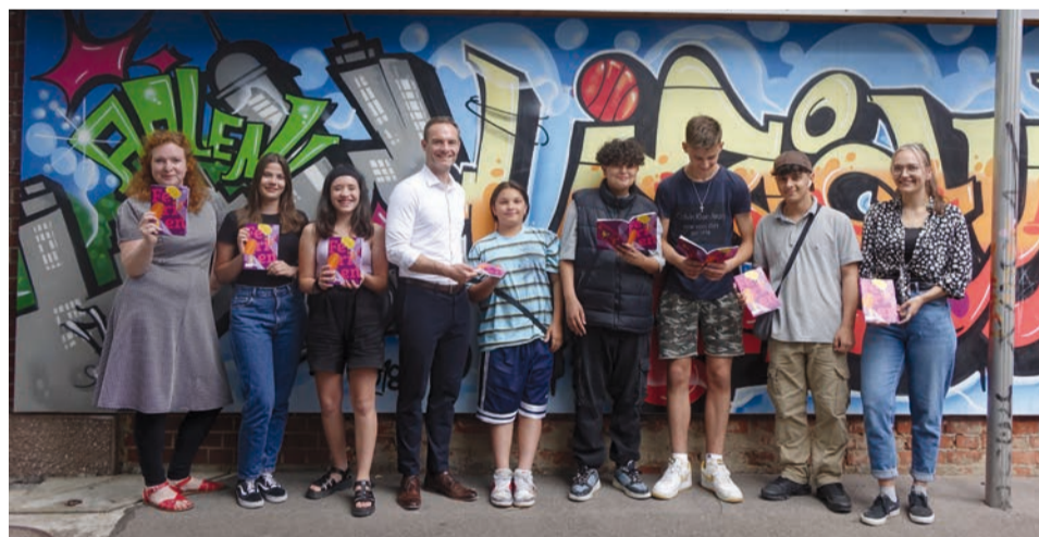
Oberbürgermeister Frederick Brütting bei der Vorstellung des Aalener Sommerferienprogramm 2022 im Haus der Jugend

Durch die aktive Beteiligung vieler Vereine, Institutionen und Bürgern ist es wieder gelungen, ein abwechslungsreiches Angebot für die Sommerferien für Aalener Kinder zu gestalten. Das Ferienprogrammheft ist unter www.aalen.de/ferienprogramm online abrufbar.