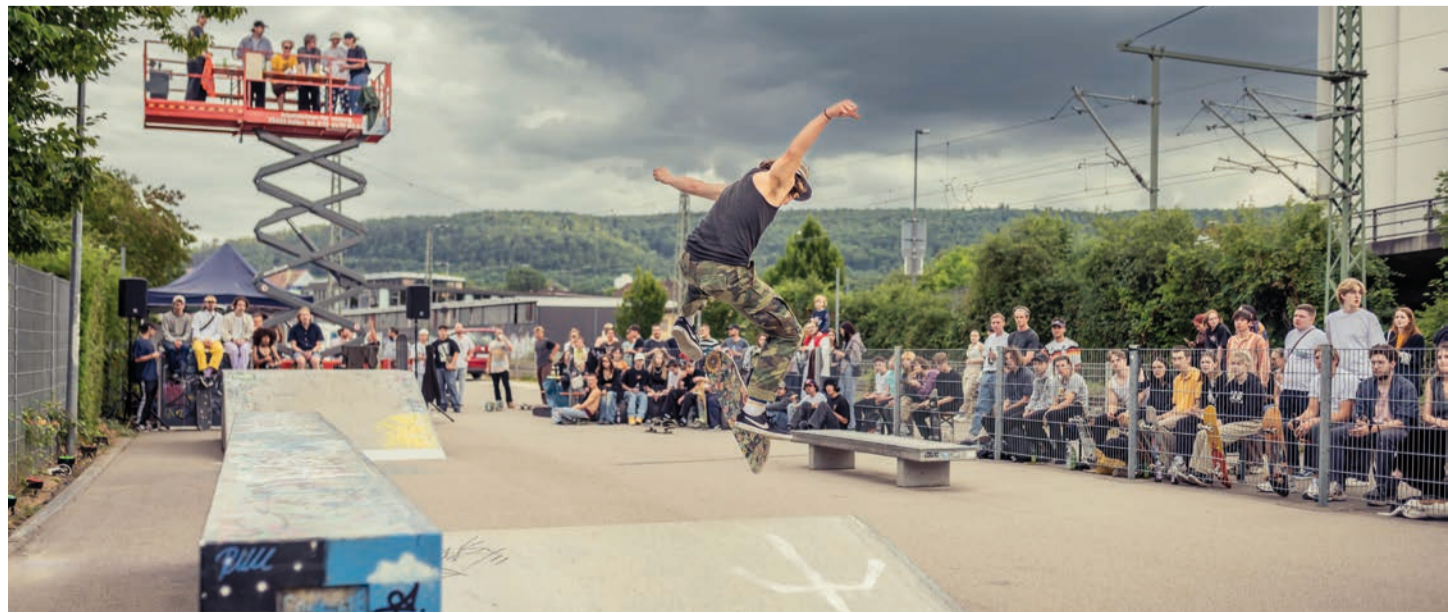
Das Stadtjugendreferat hatte am Wochenende zu einer langen Nacht der Jugendkultur unter dem Motto „Aalen in Aktion“ eingeladen.

Angestoßen wurde die „Lange Nacht“ von der Landesvereinigung Kulturelle Jugendbildung Baden-Württemberg, um ein Schlaglicht auf die „Breite und Vielfalt“ der Jugendkultur im Land zu werfen. In Aalen konnte man sich am Samstag ein Bild von dieser Vielfalt machen.