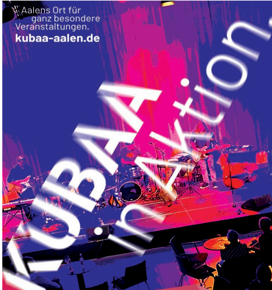
Am Freitag, 22. Juli und Sonntag, 24. Juli präsentieren Musikschule, Kino am Kocher und Theater im KUBAA ein vielfältiges Programm.

Die Eintrittskarten kosten jeweils 6 Euro pro Tag und sind beim Kino am Kocher erhältlich.