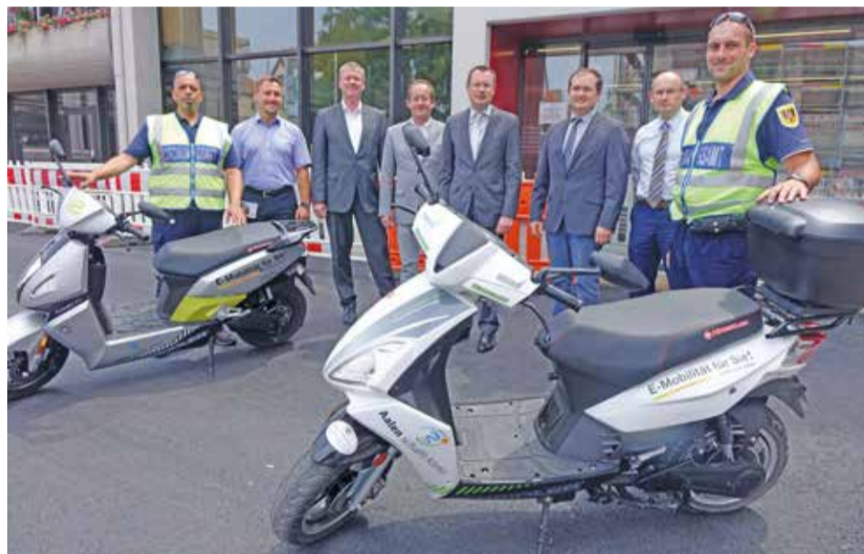
Übergabe der neuen E-Roller vor dem Aalener Rathaus.