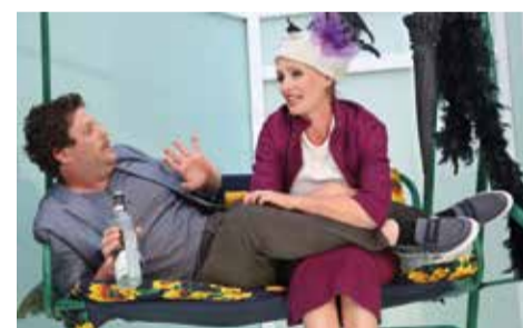
Szenenfoto aus „Mirandolina“.