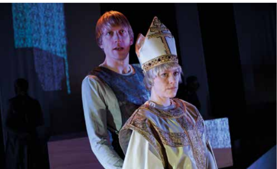
Szenenfoto aus „Die Päpstin“.

Neue Abonnements können bis zum 12. August 2016 in der Tourist-Information Aalen, Reichsstädter Str. 1, Telefon 07361 52- 2359 gezeichnet werden. Das Programm finden Sie unter: www.aalen.de