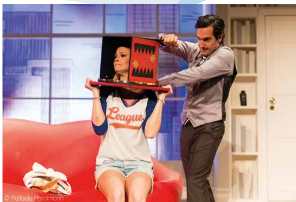
Szenenfoto aus „Zauberhafte Zeiten“.

die Gegenwart, geografisch von den USA über Österreich, Deutschland bis nach Schweden