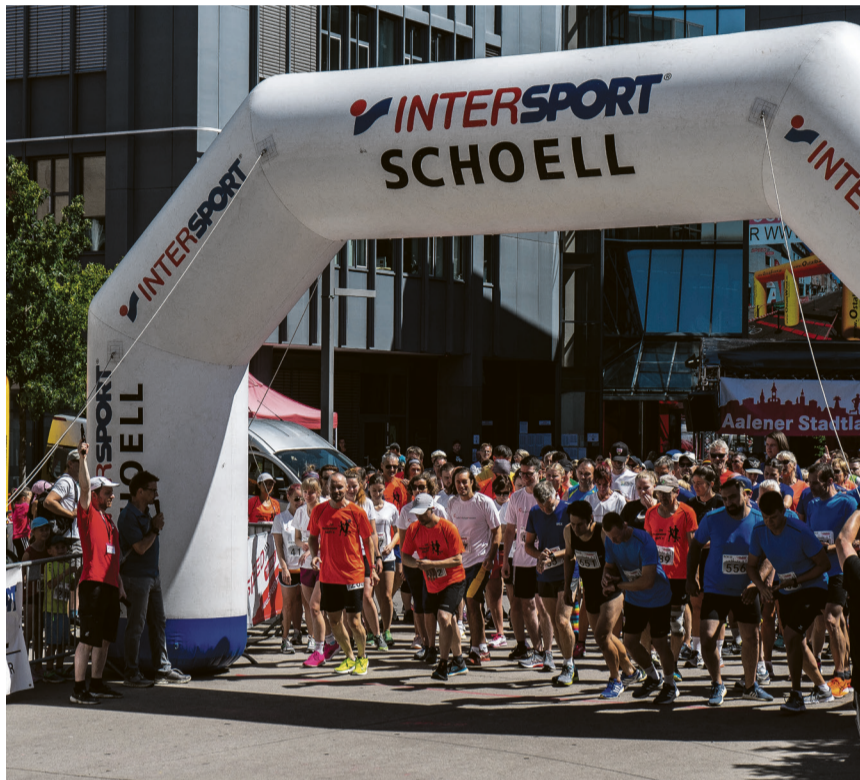
Aalener Stadtlauf - Mitmachen können alle Altersklassen und Leistungsstufen.

Die Gewinner*innen erhalten je nach Altersklasse im Rahmen einer öffentlichen Siegerehrung ihre Medaillen und auch Sachpreise. Auszeichnungen erhalten auch das kreativste oder das größte Team – nicht nur die Schnelligkeit zählt – sondern auch Teamgeist