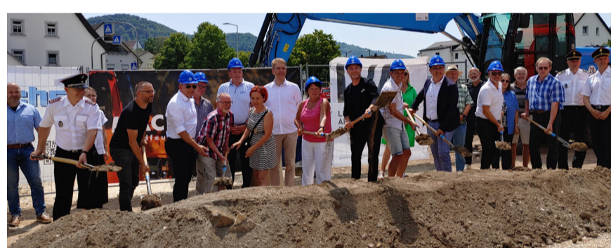
Oberbürgermeister Frederick Brütting (Bildmitte) beim Spatenstich zum neuen Feuerwehrhaus in Unterkochen. Links daneben Unterkochens Ortsvorsteherin Martina Lechner. Rechts daneben Stadtarchitekt Wolfgang Balle und Erster Bürgermeister Wolfgang Steidle.

OB Brütting betonte, im Vergleich zu einem herkömmlich errichteten Gebäude aus Beton und Ziegeln würde man in etwa 47 Tonnen CO2 einsparen. „In Sachen Klimaneutralität gehen wir da mit gutem Beispiel voran.“, so der Oberbürgermeister. Er dankte allen Beteiligten