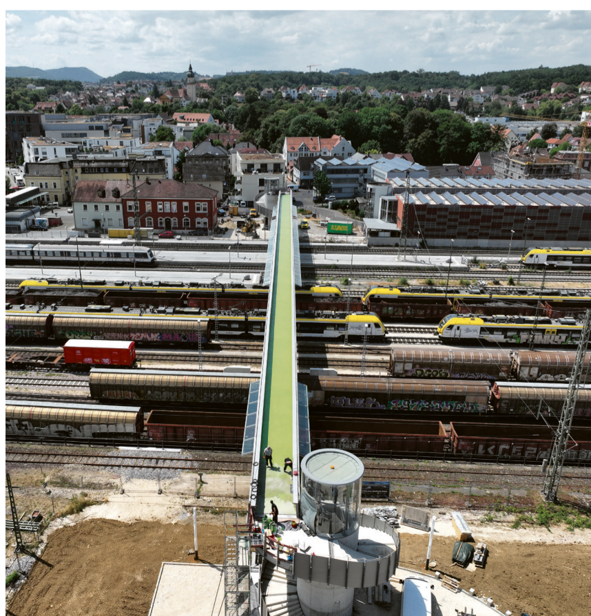
Blick auf das Stadtpanorama über den neuen Fußgängersteg

Ab 15 bis 18 Uhr lädt die Stadt Aalen alle Bürger*innen zu verschiedenen Themenführungen durch das Quartier Stadtoval, zum Fußgängersteg und auch in den Kulturbahnhof ein. Für die Bewirtung mit Getränken und Kuchen sorgen das DRK und der Blauwagen (Haus der Jugend). Nähere Informationen dann ab 19. Juli unter www.aalen.de .