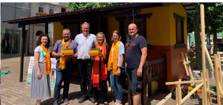
Gemeinsam für den guten Zweck