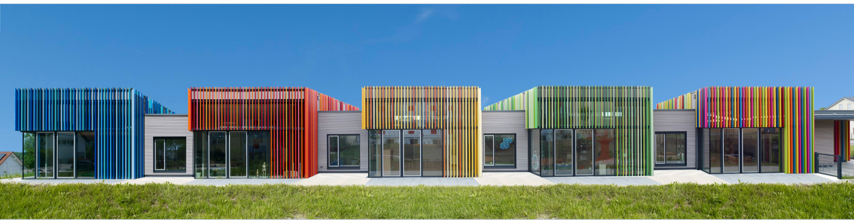
Beeindruckende Farbkontraste beim Kita-Neubau KibiZ in Dewangen