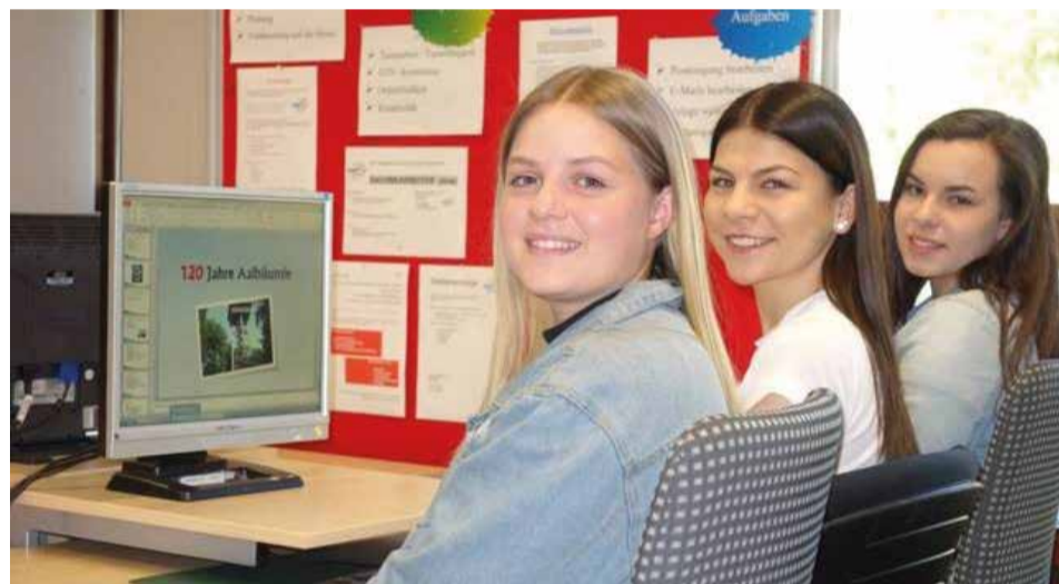
Schülerinnen bei der Arbeit in der Übungsfirma.