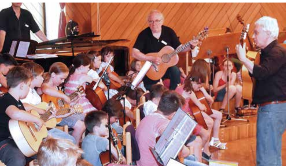
Tag der offenen Tür 2016.