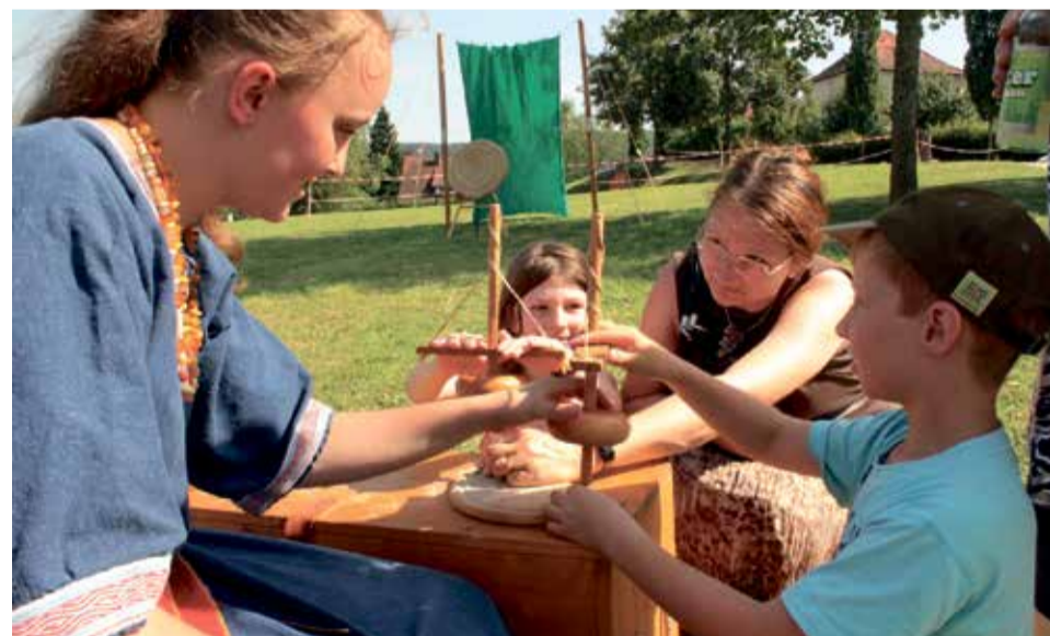
Holzbearbeitung - eine von vielen Aktionen am UNESCO-Welterbetag.