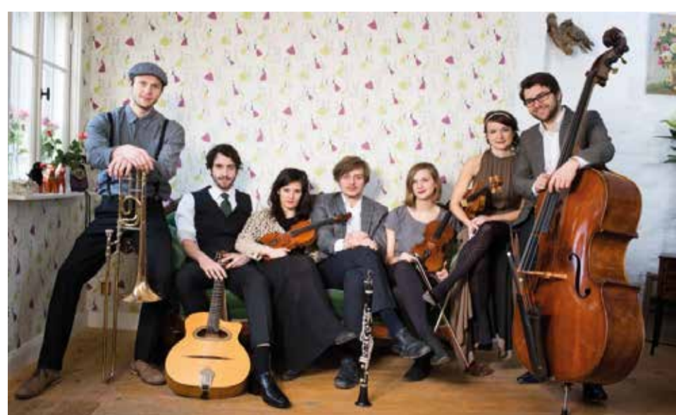
Jung, wild, musikalisch. Die Gruppe Yxalag präsentiert Klezmer in all seinen Facetten.