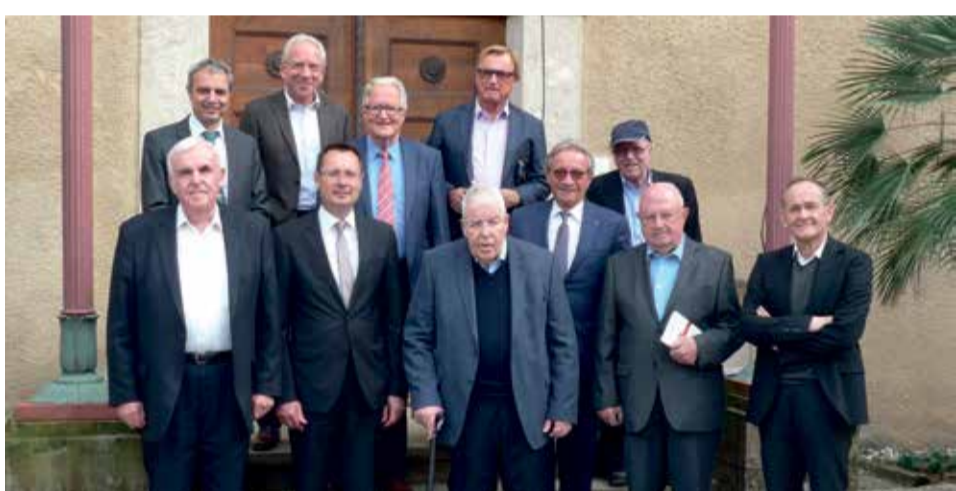
Treffen der Ehrensenatoren auf Schloss Fachsenfeld.