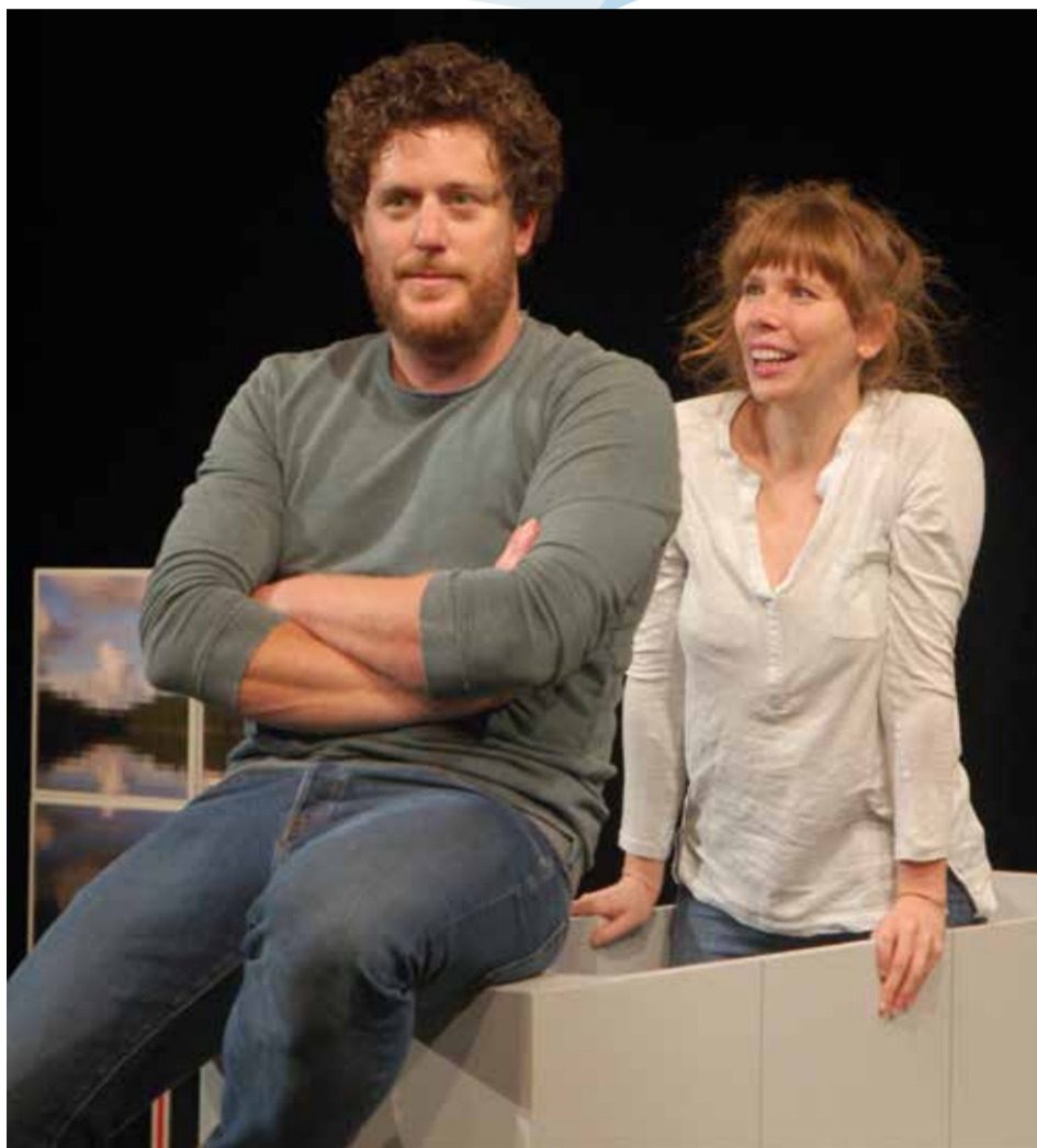
Die Geschichte von Lena (Wiederaufnahme in der Spielzeit 2017/2018),

Auch in dieser Spielzeit ist das Theater der Stadt Aalen mit einer Aufführung in der Stadthalle Aalen zu Gast. Im Rahmen des Theaterring-Abos steht ein Bürgerchor aus