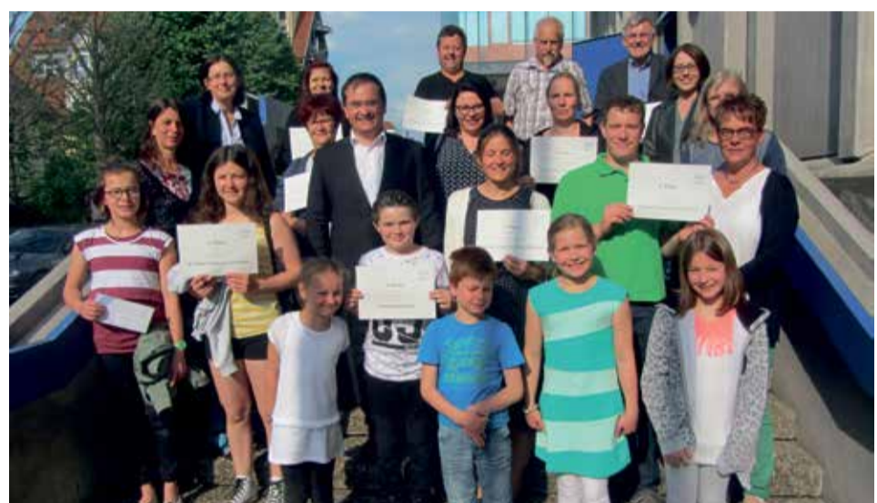
Die Gewinner der diesjährigen Flurputzete.