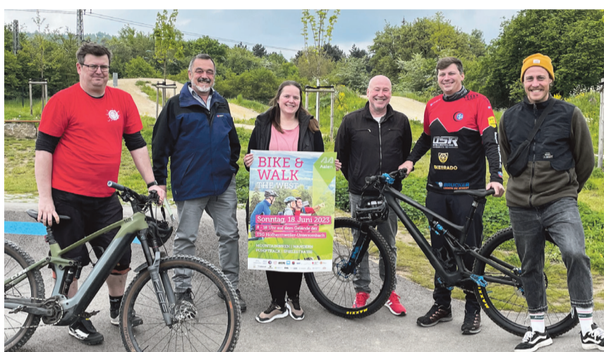
Die Initiator*innen freuen sich bereits auf das sportliche Großevent am 18. Juni.