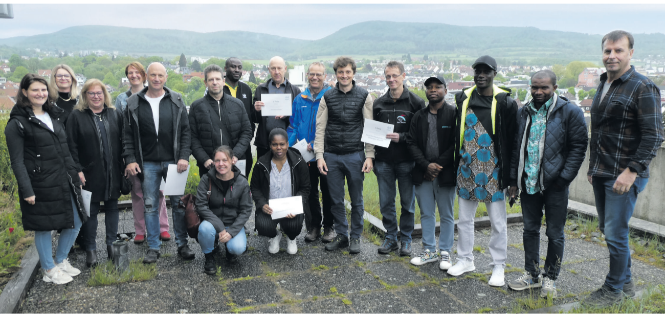
Die Sieger*innen der diesjährigen Flurputzete können sich über verschiedene Preise freuen.