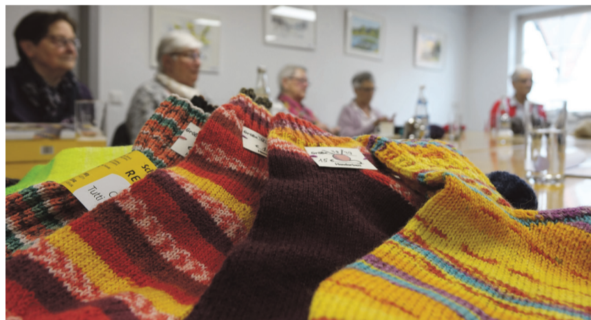
Die von den „Herzmaschen“ gefertigten Socken sind in jeder Größe und Farbe erhältlich.

Die von den „Herzmaschen“ gefertigten Socken sind in jeder Größe und Farbe erhältlich. Interessierte können telefonisch Bestellungen aufgeben und ihre Wunschgröße und -farbe angeben. Alternativ können die Socken direkt im Bürgerspital Aalen gekauft werden. Die Preise für die Socken liegen zwischen