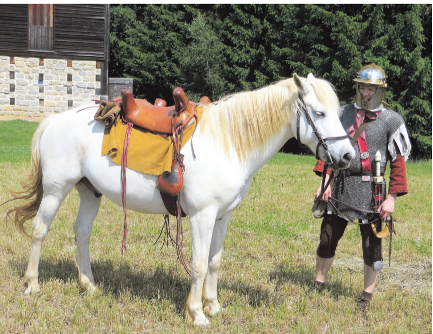
Im Kastell Aalen waren in römischer Zeit bis zu tausend Reiter untergebracht.

Kosten: 5 Euro für Material plus Museumseintritt (6 Euro Erwachsene, 4 Euro ermäßigt, 13,50 Euro Familienkarte).