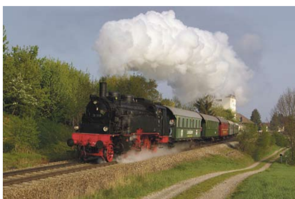
Dampfzug in Heimertingen

In Aalen beginnen die Feierlichkeiten bereits am Samstag, 16. Juli 2011, um 15 Uhr. Die Neue Tanzschule Aalen veranstaltet an beiden Tagen ihr großes Sommerfest auf dem Bahnhofsvorplatz mit einem attraktiven Bühnenprogramm und vielen Tanzvorführungen. Die jungen Gäste sind auf dem ICE-Bobby-Train-Parcours, der Hüpfburg oder auf dem