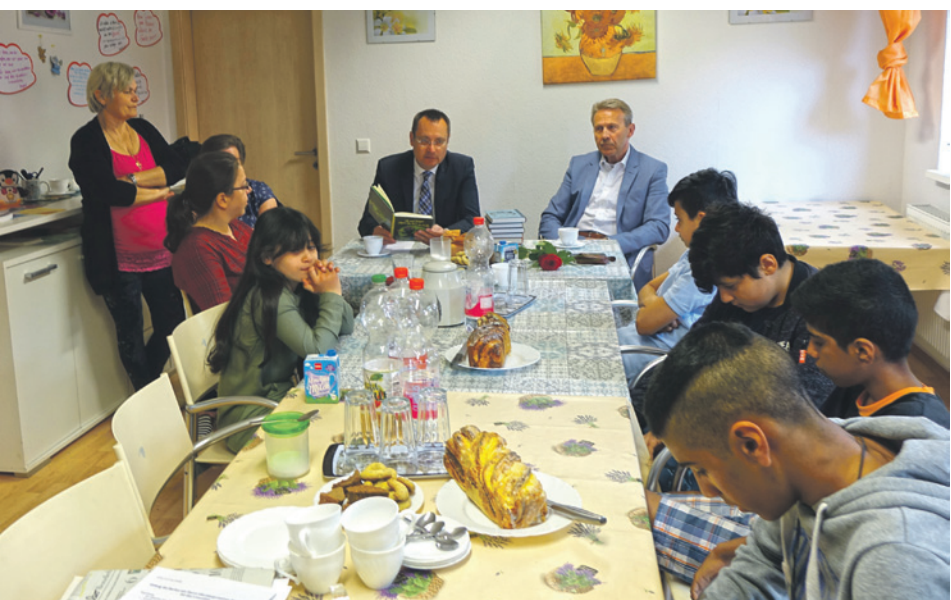
Oberbürgermeister Thilo Rentschler las den Kindern und Jugendlichen vor.