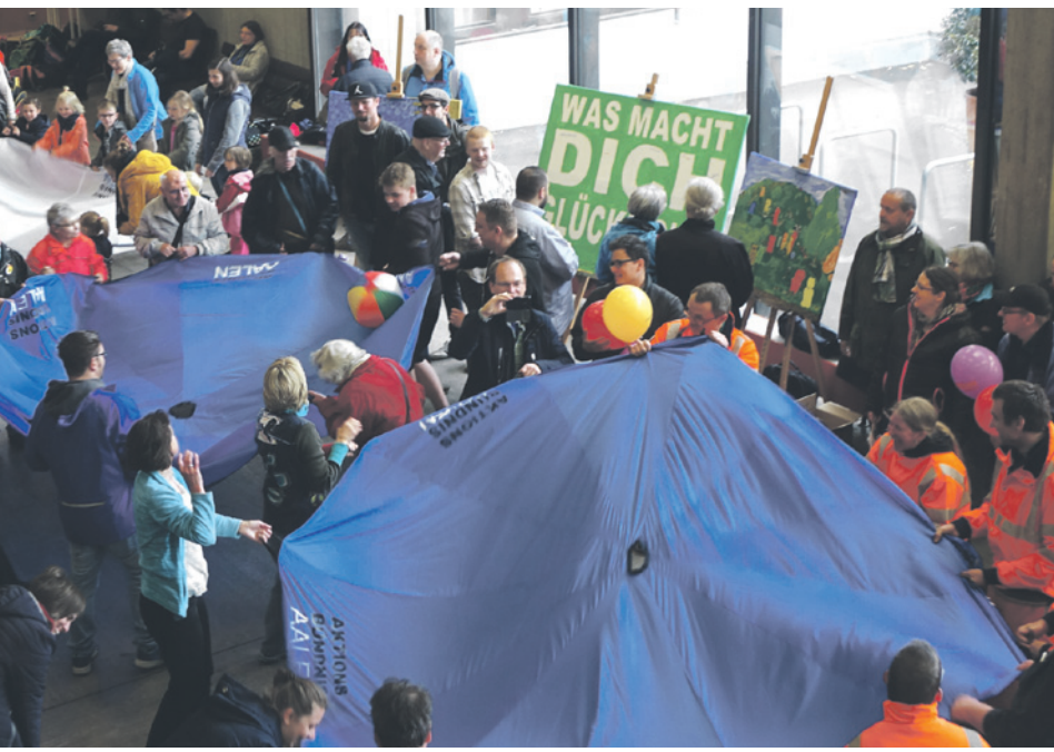
Aktionstag zur Gleichstellung von Menschen mit Behinderung.

Der Themenmonat Mai „Inklusionswege in Aalen“ hat das Ziel, ein Forum für die Akteure aus dem Gemeinwesen zu ermöglichen, um eine gesellschaftliche Auseinandersetzung zur Inklusion anzuregen und