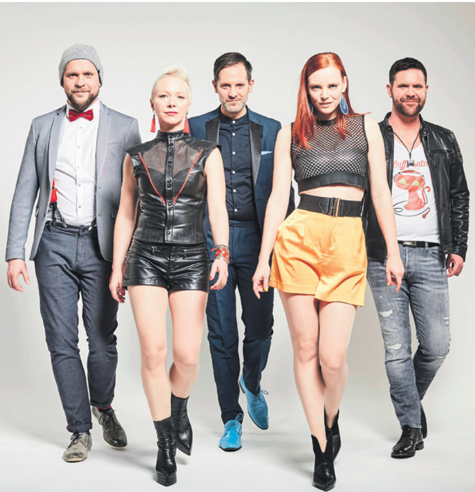
Abonnenten haben ihren Platz sicher beim Auftritt von „OnAir“ am 23. April 2020.

Seit Montag, 6. Mai 2019, können Abonnements für die neue Spielzeit des Kleinkunst-Treffs Aalen gezeichnet werden. Neben der Preisersparnis von 25 Prozent genießen Abonnenten weitere Vorteile. Sie haben für alle sechs Vorstellungen ihren festen Sitzplatz in der Stadthalle. Zudem ist der Pass übertragbar. Das Abonnement kostet 117 Euro, wer einen Familienpass besitzt, bekommt 35 % Rabatt und zahlt 76 Euro.