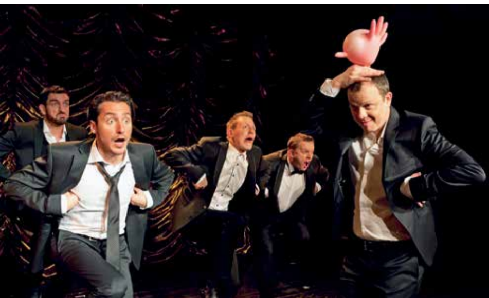
Ein Höhepunkt der Spielzeit 2016/2017, die Schweizer A-cappella-Gruppe „Bliss“.