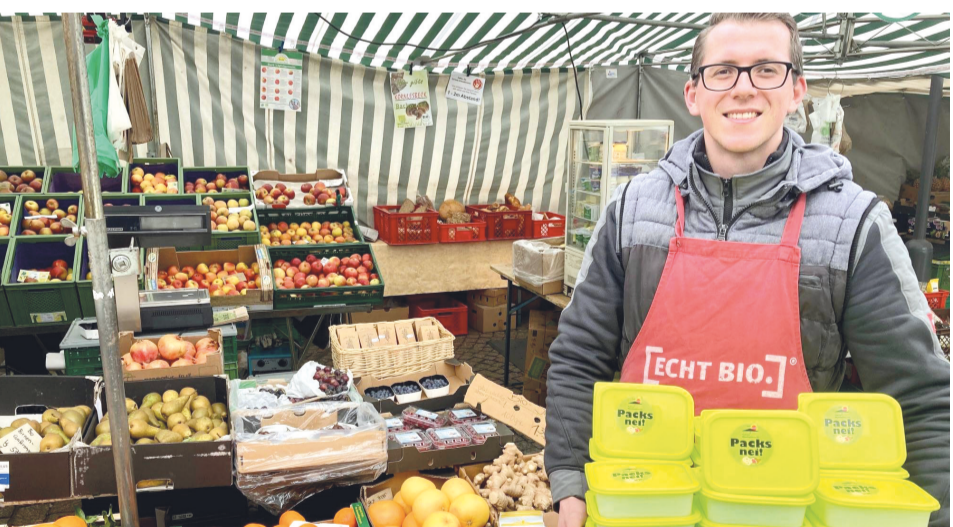
Auf dem Aalener Wochenmarkt werden seit kurzem Frischhalteboxen verteilt.

Nunmehr seit annähernd zehn Jahren, von denen Kunden bis zu zwei Mal wöchentlich, im Gebrauch, gelten die ohnehin aus anteilig recyceltem Material gefertigten ständigen Begleiter längst als Paradebeispiel für unverwundliche Langlebigkeit. Rund zwanzigttausend Taschen wurden seither kostenlos an die Kunden verteilt