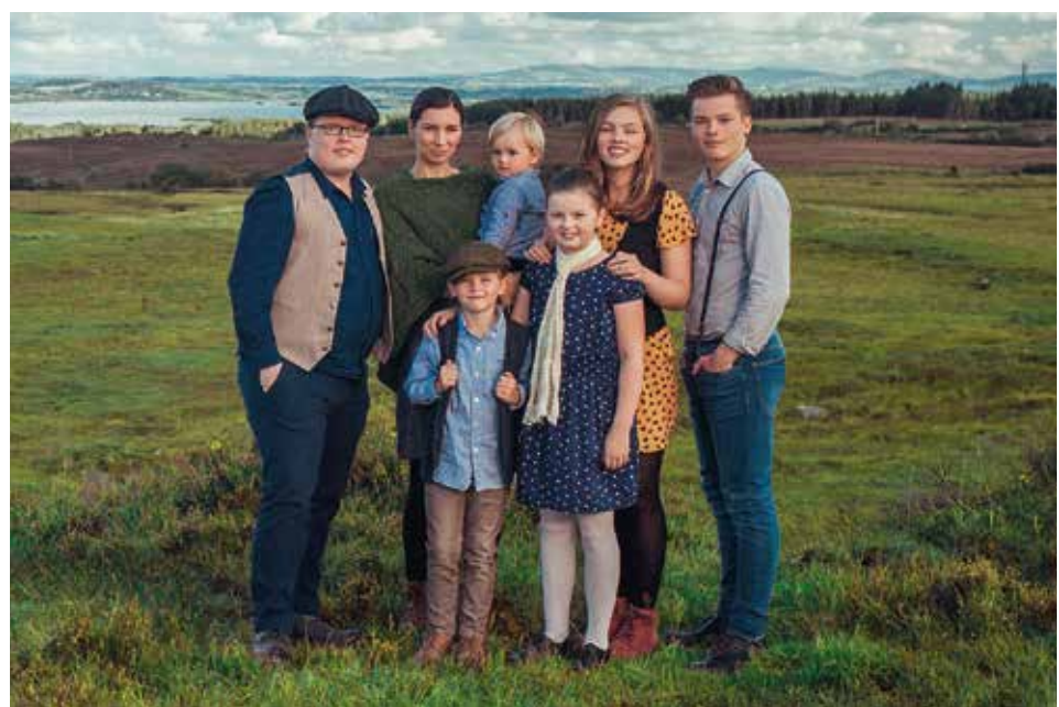
Angelo Kelly und Familie kommt nach Aalen.

Karten zum Preis von 32 Euro/25 Euro sind im Vorverkauf erhältlich unter www.reservix.de oder beim Touristik-Service Aalen, Telefon 52-2358, bei MusikA oder in den Filialen der Kreissparkasse Ostalb.