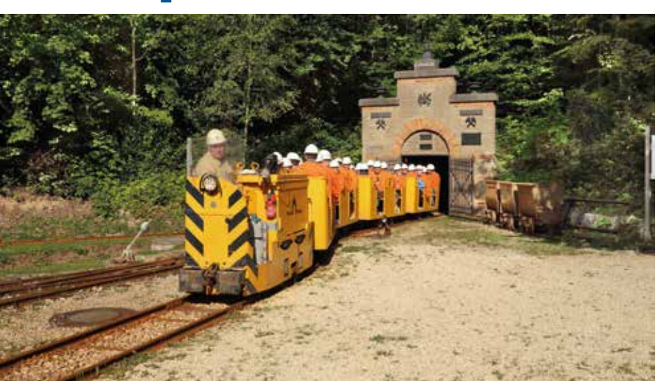
Saisoneröffnung am Wochenende.