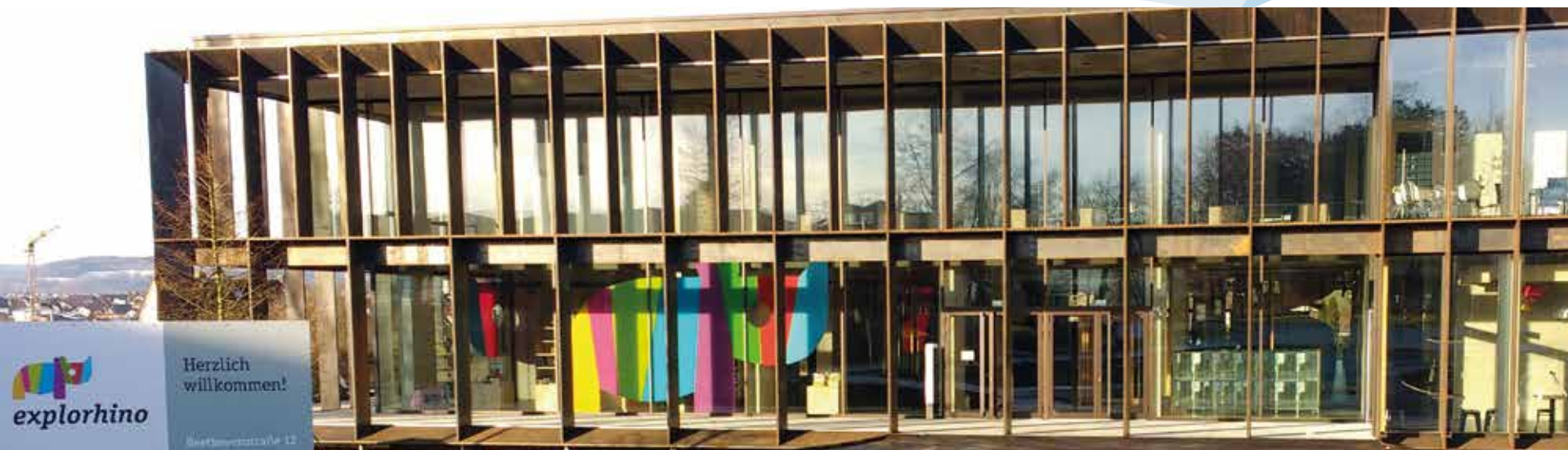
Das explorhino Science Center eröffnete am Samstag, 17. März auf dem Campus der Hochschule Aalen.

IM EXPLORHINO SCIENCE CENTER IN AALEN IST WISSEN MIT DEN HÄNDEN ZU GREIFEN