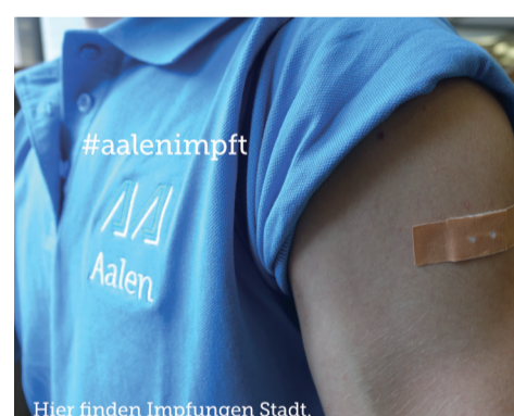
Hier finden Impfungen Stadt.

Bei Fragen steht die Corona-Hotline unter Telefon 07361 52-1155 gerne zur Verfügung. Nähere Informationen gibt es unter www.ostalbkreis.de .