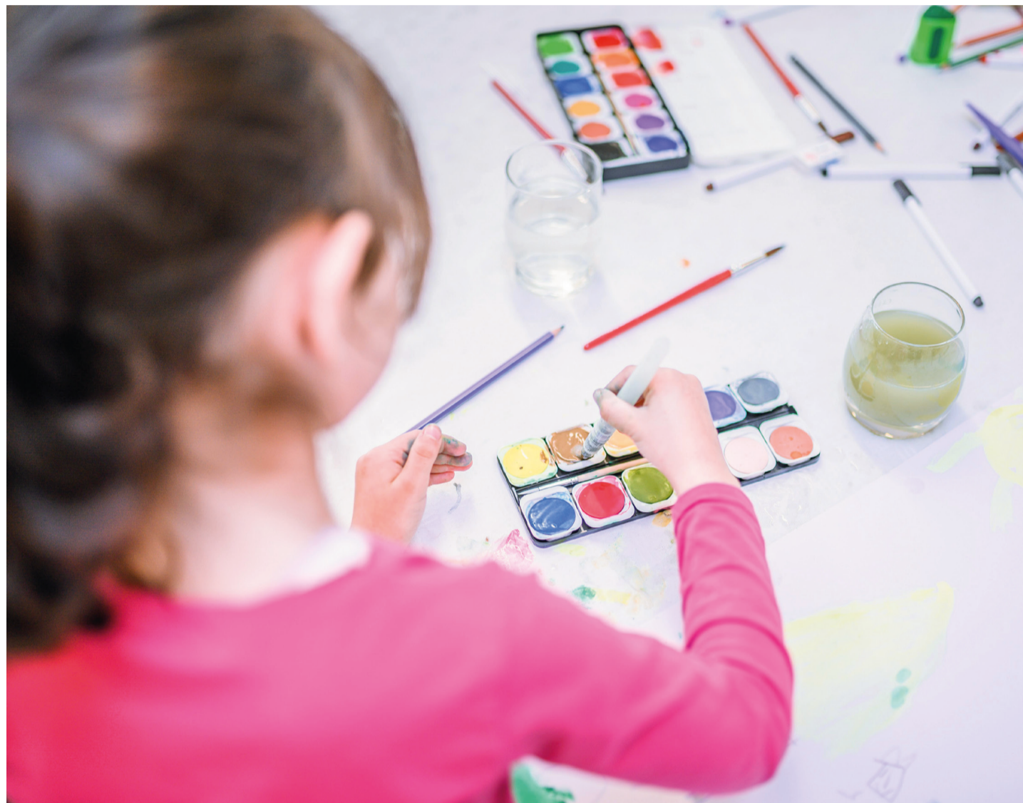
Das neue Programm der Kooperative Jugendkunstschule steht unter dem Motto „MITeinander - DURCHeinander.“

Beispielsweise kann man in der Stadtbibliothek lernen, wie man einen Comic zeichnet, beim Kollektiv K, wie man eine eigene Sammelmappe bindet. Oder man informiert